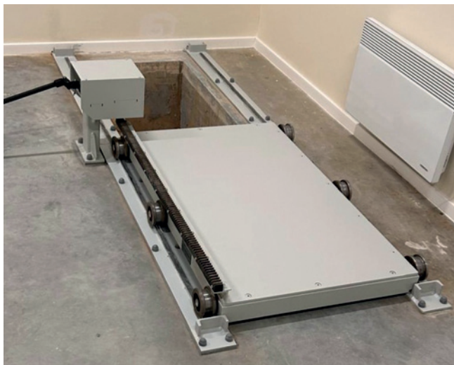
Rys. 4. Specjalistyczna osłona antyradiacyjna zabezpieczająca miejsce magazynowania izotopów

z pomocą napędu elektrycznego, jak poprzednio, z możliwością ręcznego awaryjnego otwarcia. Oczywiście istnieją drzwi rozwieralne z ochronną warstwą ołowiu otwierane klasycznie, bez napędu mechanicznego, ale stosowane są one w pracowniach, gdzie używane są źródła promieniowania o niewielkich mocach i bardzo krótkich czasach ekspozycji, np. w zastosowaniach medycznych, natomiast w naszym przypadku rozważamy zastosowanie osłon w sektorze energetycznym, gdzie wykorzystywane są źródła o dużej mocy, w związku z czym i drzwi są wielokrotnie cięższe.