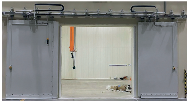
Rys. 2. Brama rozsuwana z wypełnieniem ołowianym w czasie montażu

uzyskać szerokie światło otworu. Zasady konstrukcji, zachowania wymaganego stopnia ochrony i szczelności radiologicznej, jak również napęd i zabezpieczenia są analogiczne jak w przypadku bram przesuwnych.