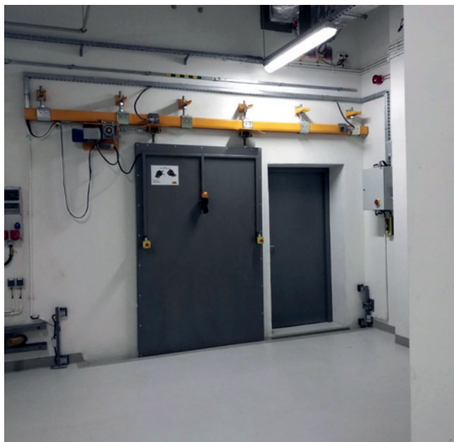
Rys. 3. Drzwi oraz brama przesuwna z wypełnieniem ołowianym

Drzwi przesuwne z wypełnieniem z ołowiu. Drzwi przesuwne stosowane są w laboratoriach i miejscach o ograniczonej przestrzeni. Jako wypełnienie ochronne używamy głównie ołowiu. Wymagają precyzyjnych prowadnic i uszczelnień gwarantujących szczelność radiologiczną, gdyż sąsiadują one najczęściej z pomieszczeniami, w których mogą przebywać ludzie. Do przesuwania tych drzwi stosujemy napęd elektryczny oraz awaryjny ręczny. Drzwi takie posiadają zabezpieczenia podobne jak bramy.