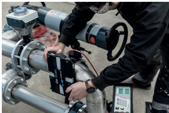
Rys. 5. Przenośny system rentgenowski Teledyne ICM. Badanie rentgenowskie spoiny na rurociągu

Dla dopełnienia obrazu badań nieniszczących należy wspomnieć również o innych metodach, które mają zastosowanie w sektorze energetycznym. Metody te pokrótce zostały zaprezentowane w dalszej części artykułu.